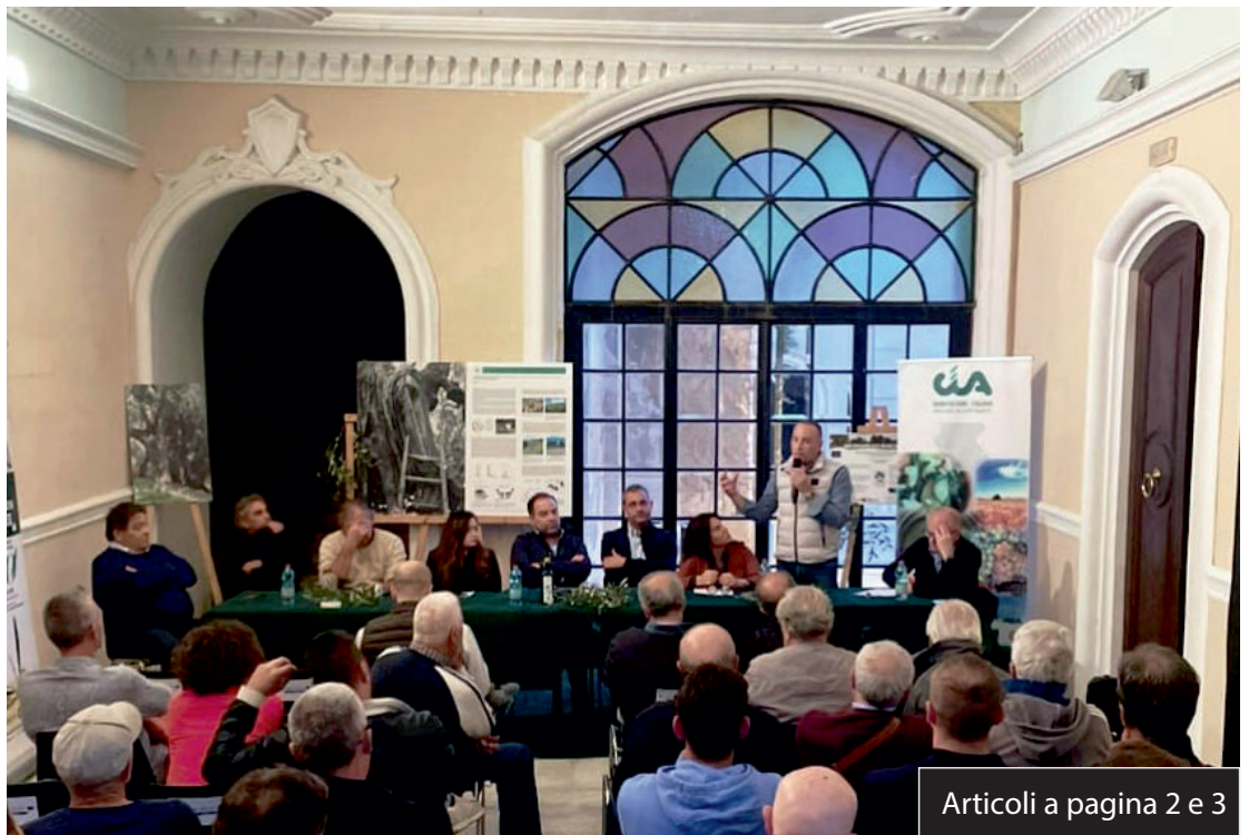
Articoli a pagina 2 e 3

La proposta è stata avanzata durante un convegno a Palazzo della Bella